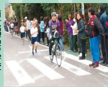
小学校持久走大会での先導

全国大会でも活躍する南大隅高校自転車競技部は、部員の約3分の1が県外出身者。近隣の小学校の持久走大会や、南大隅町で開催された佐多岬マラソンにおいて、自転車選手の前導を行い、参加者や地域の子どもの人気者になっています。