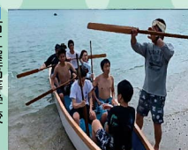
伝統の浜下り行事に参加

今春、県外から奄美大島の古仁屋高校に入学した生徒たちが、早速、地域に溶け込もうと子ども会と一緒に集落行事「浜下り」に参加しました。「集落が活気づく」と地域の方から喜ばれています。