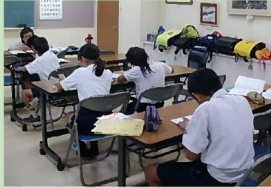
かのや学校応援団大始良地域学校支援活動