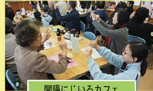
開陽にじいろカフェ

「開陽にじいろカフェ」では、地域の高齢者の方々をお迎えし、らくらく腰痛体操、ハンドマッサージ、クリスマスリース作りやおいしいお茶の入れ方講座等を行いました。アンケートから、参加者の満足度は100%でした。