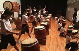
いぶ好き「ふるさと学」

伝統芸能「開聞龍宮太鼓」を素材に、小5～中1の児童生徒で、小中間の交流学习を行っています。