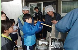
奄美の宝「黒糖」を作ろう