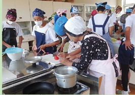
家庭科学習における調理実習

郷土料理の調理実習で、さつまあげを上手に作るポイント等、生徒たちへの調理指導・支援を行っています。