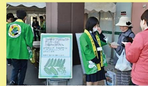
開発商品の無料配布とアンケート調査

商品開発やPR活動で指宿の特産品であるソラマメや美エンドウ等の豆類をもっと広めたい！