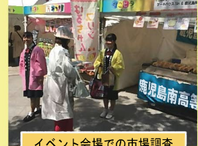
イベント会場での市場調査