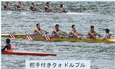
舵手付きクオドルプル

県ポート協会強化部では、かがしま国体に向けて、選手 の思いに応えることを大事にして強化を進めています。 これまで、高校や大学の垣根を越えた合同チームとして、 定期的な合同練習会や合宿を実施してきました。選手同士が お互いに刺激し合うことで、競技力の向上はもちろん信頼関係 や友情が生まれ「チーム鹿児島」が形づくられています。