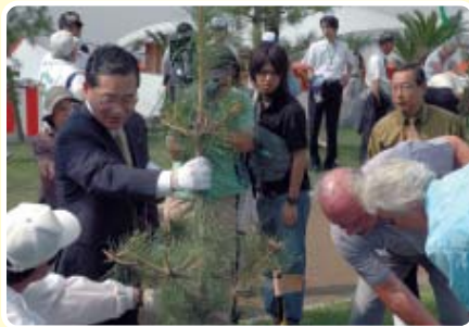
知事、観光客、森林ボランティアによるクロマツの記念植樹を行いました。