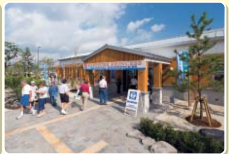
待合所 県産木材を使用しています。