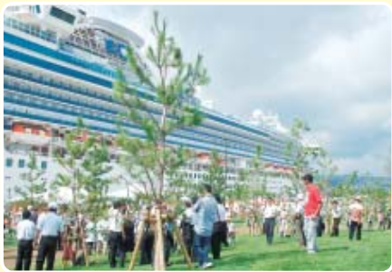
9月28日のオープンに合わせて、大型観光客船「サファイア・プリンセス」が寄港しました。