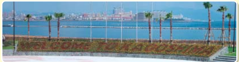
セレモニー広場(花文字) セレモニー広場では、花文字で観光客の方々をお迎えます。