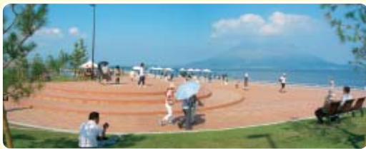
展望デッキ ここからは、360度パノラマの景色を楽しめます。