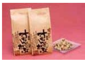
2010かごしまの新特産品コンクール 鹿児島県観光連盟会長賞

地元で生産されたサトウキビのみを使用し、一日にわずか30～40kgしか製造できない黒糖を食べやすく一口サイズにカットしました。商品のパッケージに宛名やメッセージを記入して直接発送することもできます。