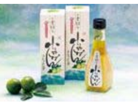
2010かごしまの新特産品コンクール 鹿児島市長賞

爽やかな酸味を持つ青切り桜島小みかんの全果実に、完熟小みかんの果汁を加え、オイルには桜島で生育する糖の実から採れる精油を使用しました。桜島の自然から生まれたちよつとぜいたくなドレッシングです。