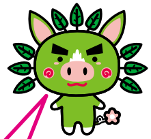
花かごしま2011 マスコットキャラクター ぐりぶー

今までより博多までは 53分 、新大阪までは 1時間17分 の短縮※になるんだ！ レジャーや観光、ショッピングはもちろん、ビジネスチャンスも大きく広がるよ！ (※最速列車の場合)