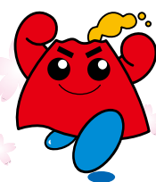
かごしまPRサポーター さくらしまん