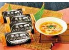
2009かごしまの新特産品コンクール 鹿児島県特産品協会理事長賞

しゃぶしゃぶから出るうま味たっぷりのだし汁を再現。昆布、椎茸、かつお節からだしを取り、丁寧に余分な脂やアクを除くことで、うま味のあるスープに仕上がりました。温めてご飯にかけてお茶漬に。卵でとじておじやに。お餅と野菜でお雑煮にどうぞ。