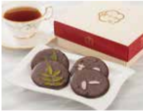
2014かごしまの新特産品コンクール 鹿児島県特産品協会理事長賞

大人の女性のためのちょっと贅沢なお煎餅。バターを使わない爽やかで上品な苦みと山椒のアフゼントが特徴で、珈琲やウイスキーにマッチします。湯之元温泉郷で70年手造りされている無添加のお煎餅にフランスヴァローナ社のカカオパウダーを贅沢に練りこみました。