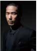
小林直己 (EXILE/三代目 Soul Brothers)