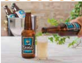
2014かごしまの新特産品コンクール 鹿児島県観光連盟会長賞

維新の英雄“西郷隆盛”は、酒が弱かった と言われています。そんな西郷さんも飲め る指宿唐船天然湧水と、屋久島タンカン 果汁を使用したフルーティーな味わいの鹿 児島ノンアルコールビアテイスト飲料です。