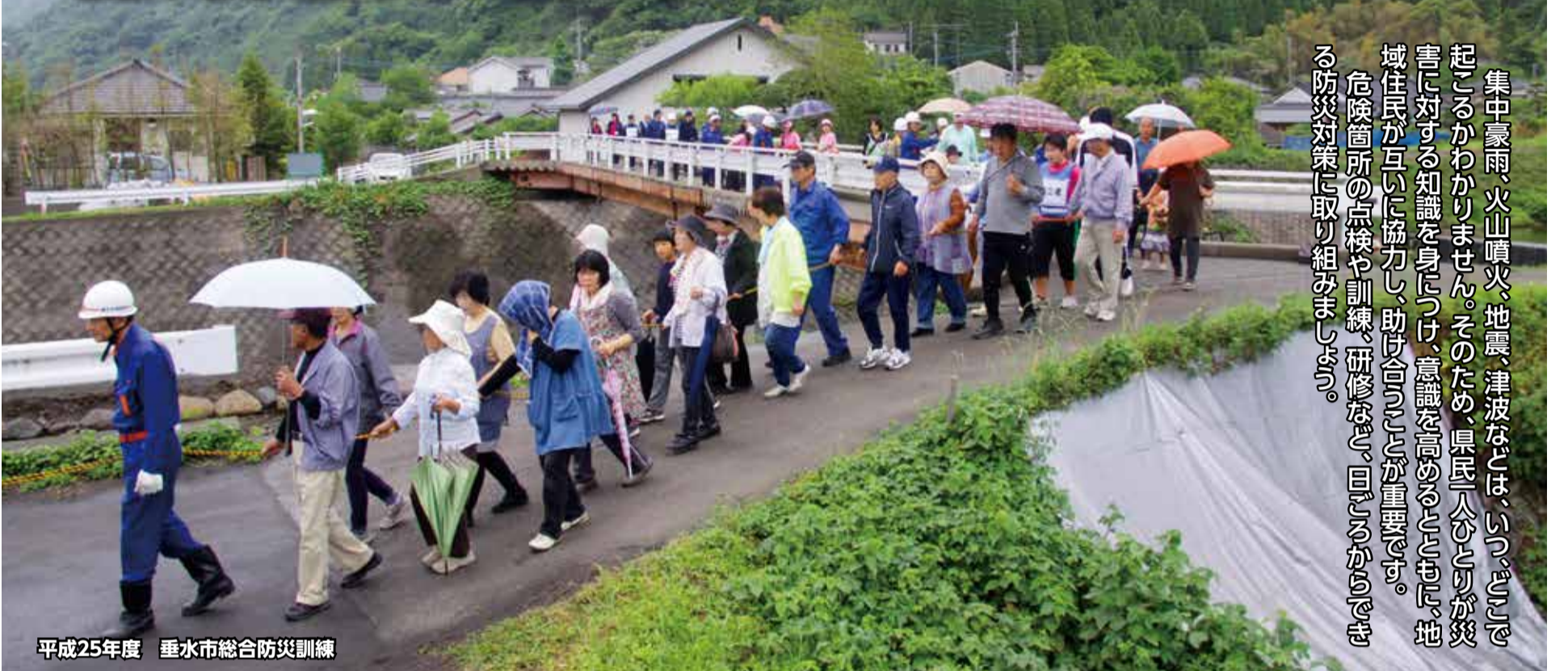
平成25年度 垂水市総合防災訓練

集中豪雨、火山噴火、地震、津波などは、いつどこで起こるかわかりません。そのため、県民一人ひとりが災害に対する知識を身につけ、意識を高めるとともに、地域住民が互いに協力し、助け合うことが重要です。危険箇所の点検や訓練、研修など、日ごろからできる防災対策に取り組みしましょう。