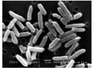
サルモネラ属菌 <食品安全委員会事務局 資料>

感染して約5時間~72時間で発症。腹痛、水様性下痢、発熱(38℃~40℃)が主な症状で、おう吐、頭痛、脱力感、けん怠感を起こす人もいます。