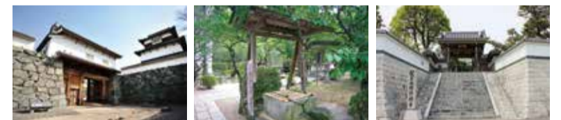
官兵衛の子で、初代福岡藩主・長官 官兵衛が隠棲した際に茶の湯で政が築城した福岡城跡(福岡市) 使っていた井戸(太宰府市) 官兵衛や長政の位牌などがまつられている円清寺(朝倉市)