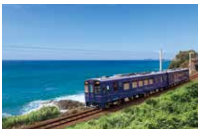
海岸線を走る「おれんじ食堂」

九州の西海岸を走る肥薩おれんじ鉄道は、薩摩川内市から熊本県八代市までを結び、海に沈む夕日やみかん畑に彩られた山々など、車窓に広がる雄大な風景が魅力です。観光列車「おれんじ食堂」は、美しい景色を楽しみながら、趣向を凝らしたお食事をゆっくりご堪能いただけます。