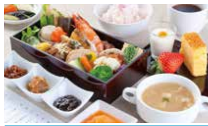
沿線の旬な食材を使用した食事(例)

九州の西海岸を走る肥薩おれんじ鉄道は、薩摩川内市から熊本県八代市までを結び、海に沈む夕日やみかん畑に彩られた山々など、車窓に広がる雄大な風景が魅力です。観光列車「おれんじ食堂」は、美しい景色を楽しみながら、趣向を凝らしたお食事をゆっくりご堪能いただけます。