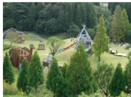
県立大隅広域公園