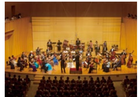
第32回霧島国際音楽祭