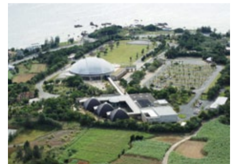
鹿児島県奄美パーク