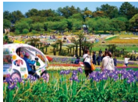
第28回全国都市緑化かごしまフェア