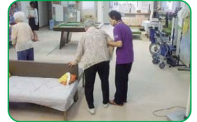
デイサービス利用者への 歩行助歩ボランティア