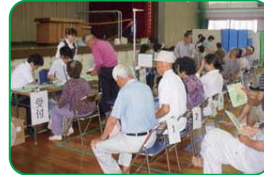
公民館などでの 集団健診への参加