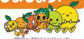
肥薩おれんじ鉄道マスコット「おれんじーず」

肥薩おれんじ鉄道は、地域住民の方々の通学・通勤などの日常生活に欠かせない地域の基幹の公共交通機関として、また、物流の基幹ルートとしての重要な役割を果たしており、観光をはじめとする地域産業の振興や地域活性化に必要な存在です。沿線には風光明媚な海岸線が連なるなど、魅力いっぱいの肥薩おれんじ鉄道をぜひ利用しましょう。