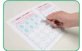
手帳にポイント(シール) の貼り付け