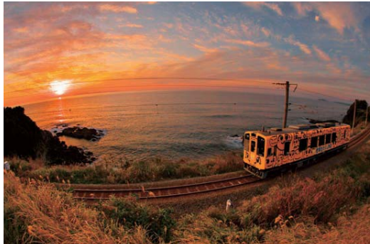
▲東シナ海に沈む夕日