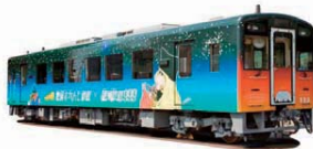
▲銀河鉄道999ラッピング列車

肥薩おれんじ鉄道では、一般の車両とは別に「銀河鉄道999ラッピング列車」や『くまモン』と『おれんじーず』のラッピング列車などユニークな企画列車も走っています。