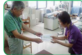
活動参加後のポイント受け取り