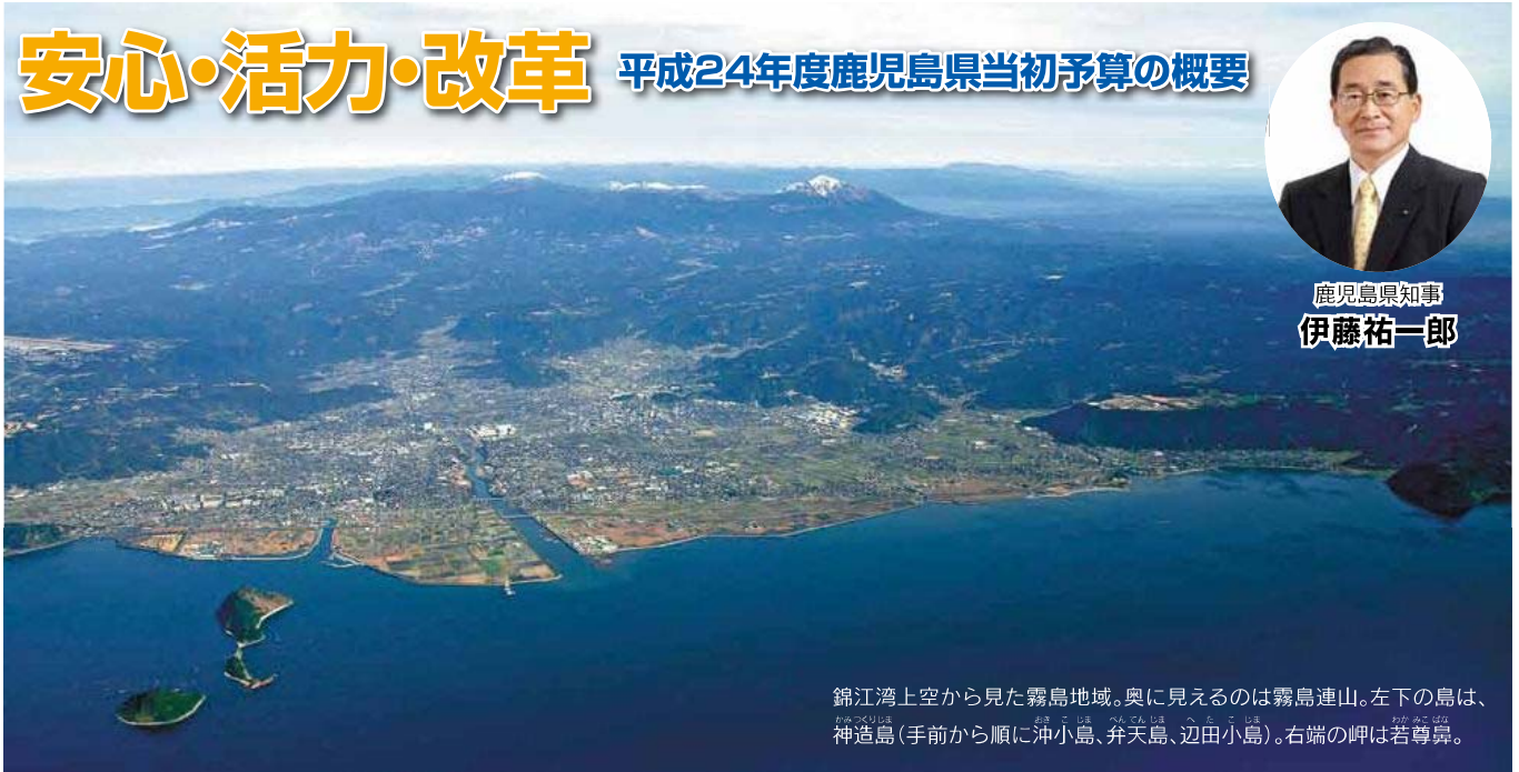
錦江湾上空から見た霧島地域。奥に見えるのは霧島連山。左下の島は、神造島(手前から順に沖小島、弁天島、辺田小島)。右端の岬は若尊鼻。

平成24年度当初予算の編成に当たっては、平成23年度3月補正予算と連携し、行財政運営戦略を踏まえた行財政改革を着実に進めながら、雇用や経済の回復に努めつつ、明るい展望をもって着実に歩みを進め、県政の発展を図る観点から、「安心・活力・改革」の予算としての編成を行った結果、4年連続のプラス予算といたしました。