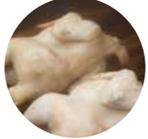
栗野岳温泉名物 鶏の地獄蒸し