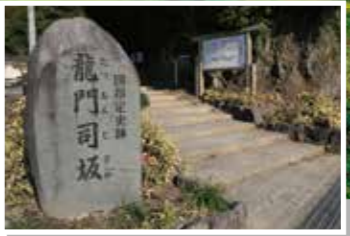
西郷どん ゆかりの 地