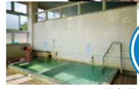
西郷どんの ゆかりの 地