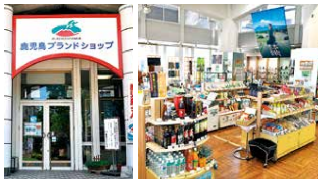
県産品総合展示販売場「鹿児島ブランドショップ」（県産業会館1階）