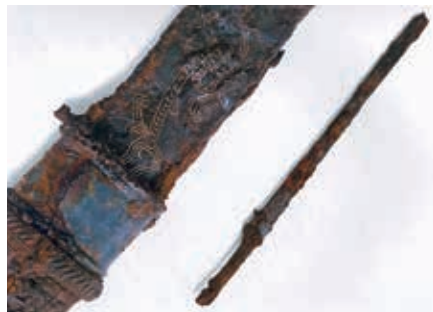
銀象嵌龍文大刀（ぎんそうがなりゅうもんたち） （島内地下式横穴墓群・えびの市教育委員会）

豊かな創造力や表現力を発揮して想いを表現し、意図的な彩色や実用性を超えた装飾が施された出土品（道具）を「色」「飾」という視点で紹介しています。現在、重要文化財である島内地下式横穴墓群出土の銀象嵌龍文大刀など、期間限定展示も行っています。