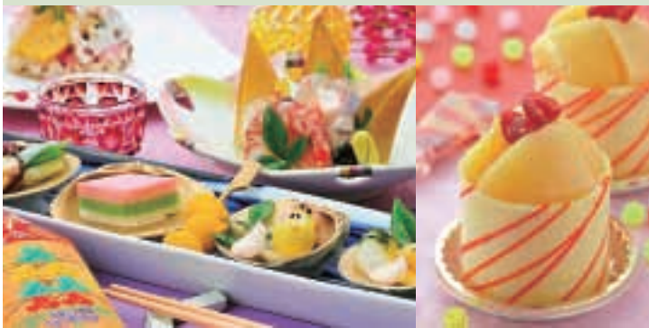
ひな御膳・ひなスイーツ(城山観光ホテル)

期間中、県内のホテル・旅館等では、篤姫の好物だったびわや桃などを使った特別なスイーツや期間限定のひな御膳が楽しめます。