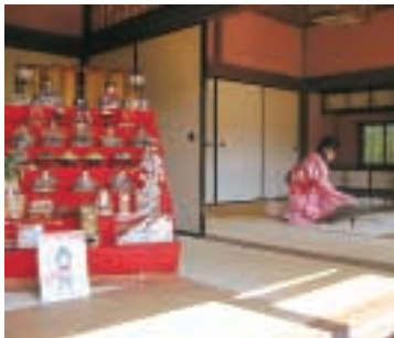
▲知覧武家屋敷群 西郷邸