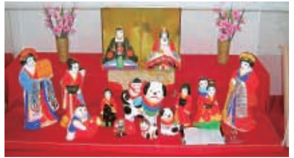
▲JR鹿児島中央駅の帖佐人形

鹿児島中央駅では珍しい帖佐人形のひな飾りや106年の歴史を持つレトロな嘉例川駅、大隅横川駅などでもひな飾りが楽しめます。