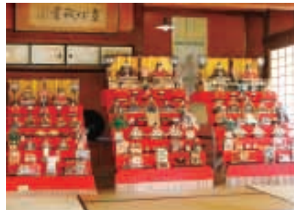
▲出水武家屋敷群 竹添邸