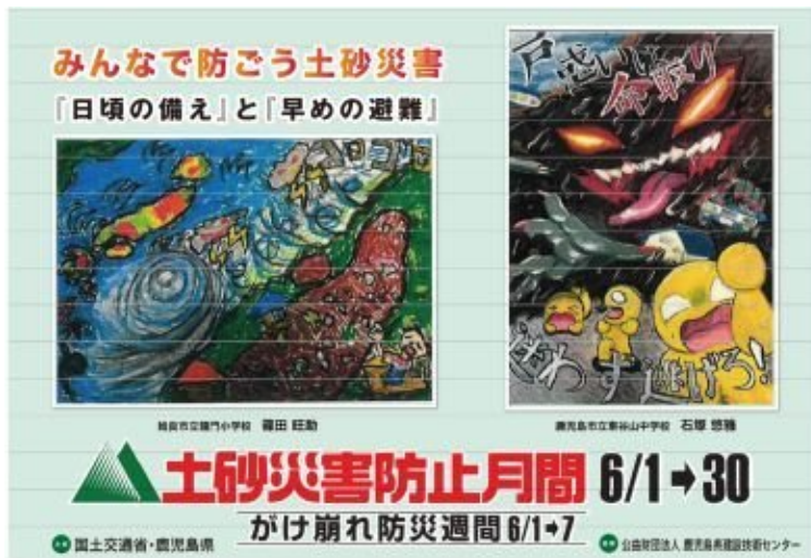
階段ポスターのイメージ