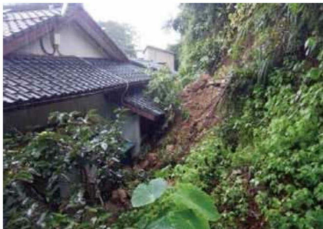
阿久根市脇本内 八郷地区で発生したかけ崩れ（令和3年8月）